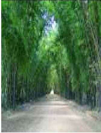
BAMBÚ TÚNEL EN VÍA

Los bambúes crean un ambiente sereno y exótico en su Jardín, Sala o en su Cuarto de Baño gracias a la abundancia de verdor, a los bambú les gustan las atmósferas húmedas y luminosas.